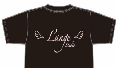
スタジオTシャツ新ロゴ