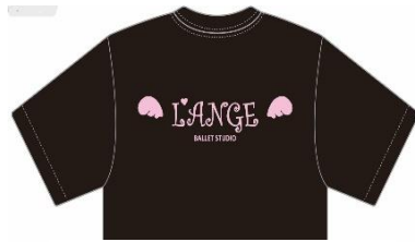
スタジオTシャツベーシック