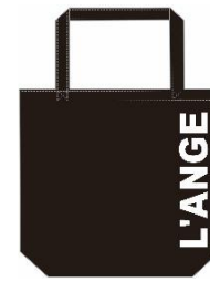
トートバッグ 上：トートバッグ 下：ランチトート