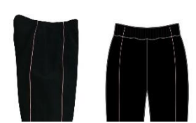
ジャージパンツ （ジャケットはベーシックロゴ）